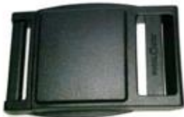
PKM8010 ( passend zu beiliegendem Gurtband von Comfit AFO)