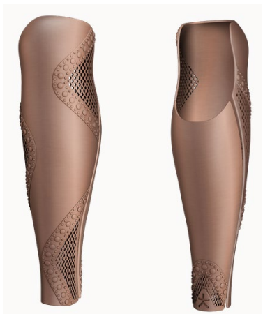
Design: Dew | Farbe: Rose Gold