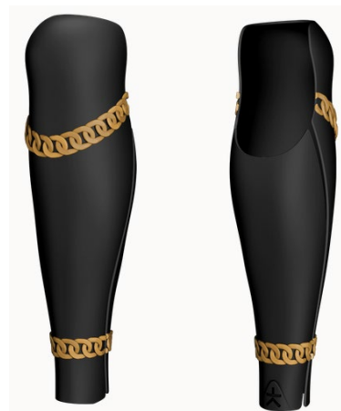
Design: Link | Farbe: Black/Gold