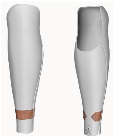
Design: Halo | Farbe: Metallic Silver/Brown Leather

Alle Designs sind für Ober- und Unterschenkel, sowie als Hart- und Flexibles-Cover erhältlich! Folgende Designs sind in dieser Kategorie enthalten (weitere Farben finden Sie im Bestellformular):