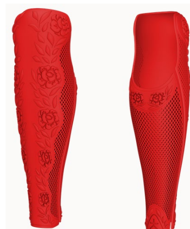
Design: Eden | Farbe: Pure Red