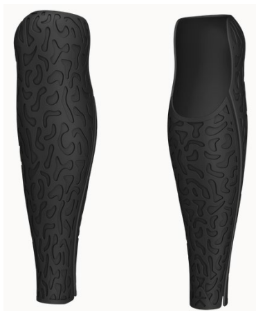
Design: Forma | Farbe: Black Matte