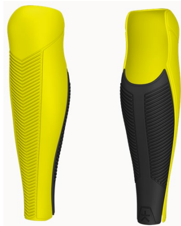
Design: Blaze | Farbe: Sunny Yellow/Black Matte