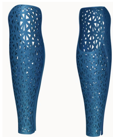
Design: Mesh | Farbe: Metallic Blue