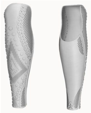
Design: Icon | Farbe: Metallic Silver

Alle Designs sind für Ober- und Unterschenkel, sowie als Hart- und Flexibles-Cover erhältlich! Folgende Designs sind in dieser Kategorie enthalten (weitere Farben finden Sie im Bestellformular):