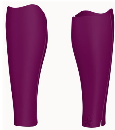
Design: True | Farbe: Berry Purple