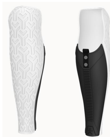
Design: Prime | Farbe: Metallic Silver/Black Matte