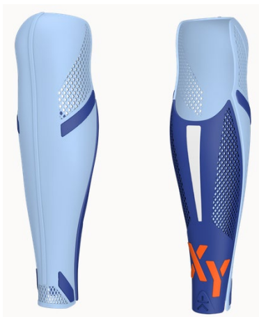
Design: ID | Farbe: Blue/Orange/White