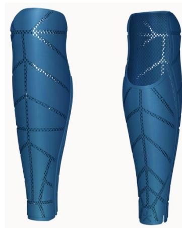
Design: Armour | Farbe: Metallic Blue