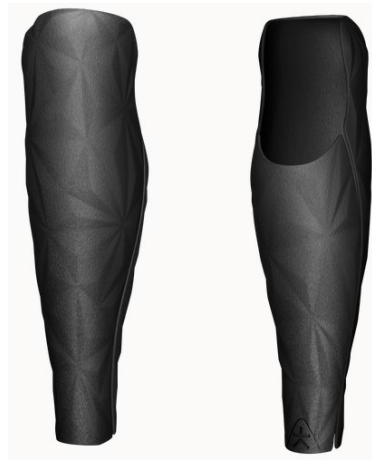
Design: Prism | Farbe: Black Basic