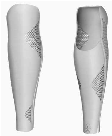
Design: Arc | Farbe: Metallic Silver

Alle Designs sind für Ober- und Unterschenkel, sowie als Hart- und Flexibles-Cover erhältlich! Folgende Designs sind in dieser Kategorie enthalten (weitere Farben finden Sie im Bestellformular):