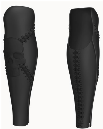
Design: Phantom | Farbe: Black Matte